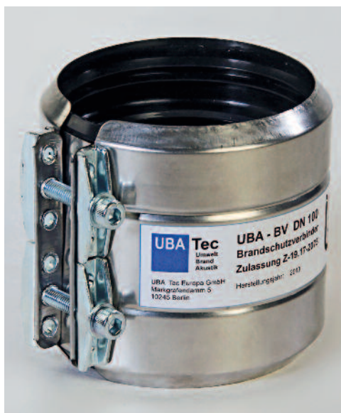
Bild 1 • Der UBA-BV Brandschutzverbinder ist eine einfache und sichere Abschottung (mit abZ) für Gussrohre bei Mischinstallationen.