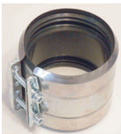
Rohrverbinder aus Edelstahl mit Brandschutzeigenschaften für Rohrsysteme aus Gussrohr nach DIN 19522/EN 877. Geprüft nach DIN EN 877.